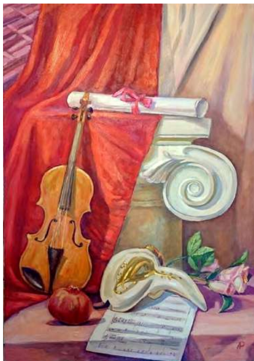
«Театральный натюрморт», 2019 г. Х., м. 70x50 см

Темы и образы рождаются из жизни. Абстрактных работ у меня нет, так или иначе все они связаны с жизнью реальной. Предугадать, что заденет и в итоге превратится в картину — невозможно. Натюрморты и пейзажи с натуры, размышления над библейскими сюжетами или сюжеты из жизни — все может оказаться на холсте. Пожалуй, наиболее затронувшие меня темы — это материнство и музыка. В 1992 году у меня