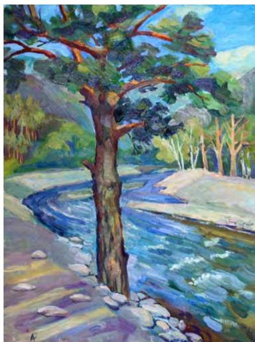
«Этюд с деревом». Х., к., м. 40х30 см

Тема детства мне близка еще и потому, что уже почти тридцать лет я преподаю в школе искусств на художественным отделении. У детей-художников