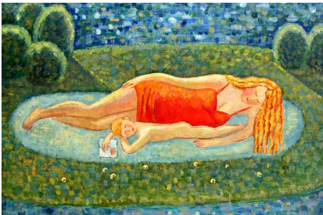
«Остров». Х., м. 40x60 см

родился сын, растить его пришлось одной в тяжелые 90-е, но в моих картинах появились светлые образы матери и ребенка.