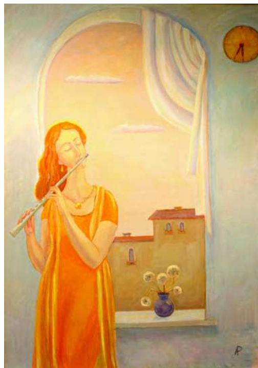
«Мелодия уходящего лета». Х., м. 70x50 см

В 1989 году я переехала жить в Санкт-Петербург, в котором кипела творческая жизнь. Начался период поисков и экспериментов. Моя первая персональная выставка прошла в 1992 году